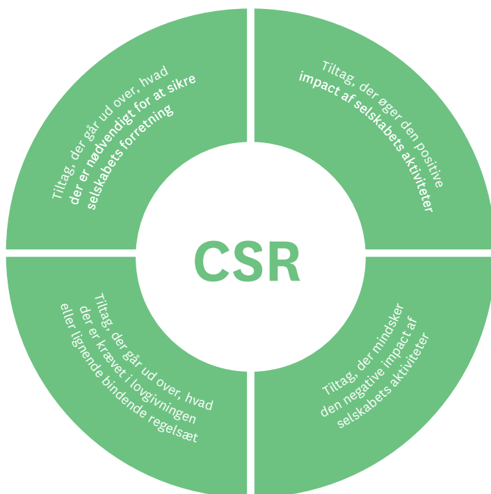
Figur 03 — CSR-aktiviteter i selskabet

Der kan imidlertid også være et ræsonnement i at vælge at arbejde med kategorierne "lille påvirkning, lille indsats" og "lille påvirkning, stor indsats", såfremt selskabet vurderer, at der er nogle særlige forhold, der gør sig gældende. Det kan for eksempel være, at selskabet ser en fordel i at gå forrest i branchen, en mulighed for at kunne opjustere standarden i branchen, eller fordi selskabet vil understøtte selskabets ejere i at fremme en agenda. Vælger selskabet at arbejde med tiltag indenfor disse kategorier, vil det altid foregå på baggrund af en konkret vurdering af det enkelte tiltag.