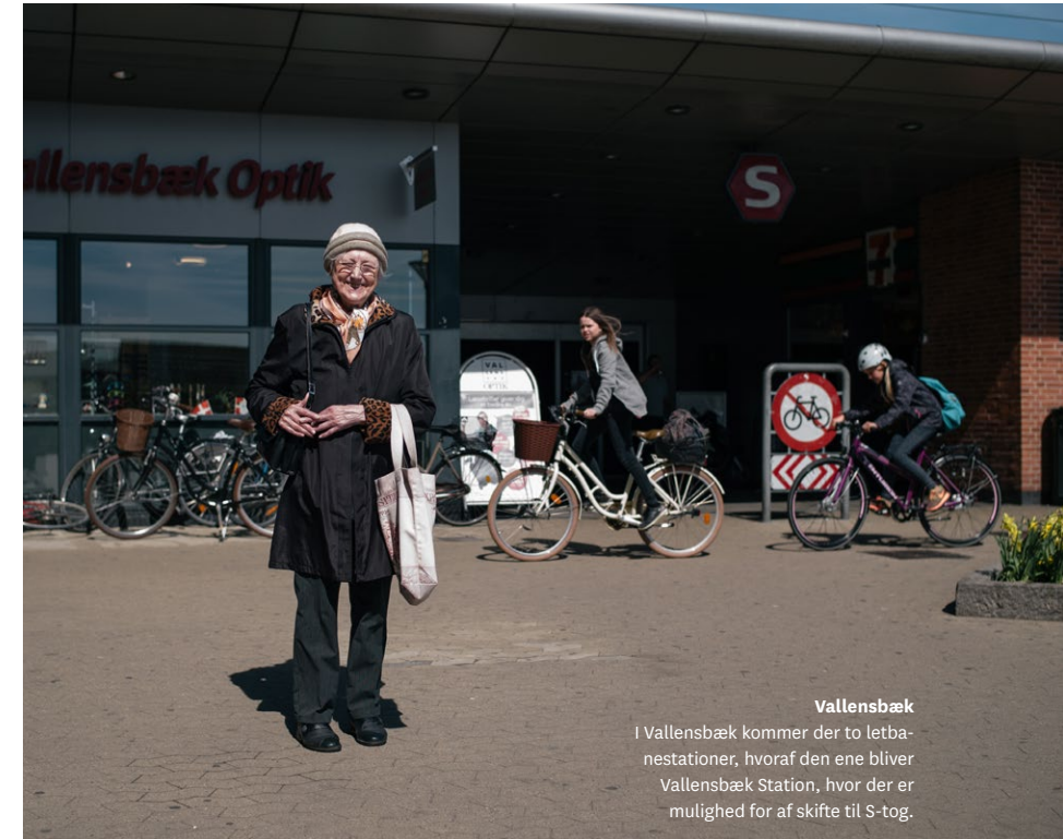
Vallensbæk I Vallensbæk kommer der to letbanestationer, hvoraf den ene bliver Vallensbæk Station, hvor der er mulighed for at skifte til S-tog.

På den baggrund er de medarbejdere i Metroselskabet, der udfører arbejde for Hovedstadens Letbane, også omfattet af en række interne administrative