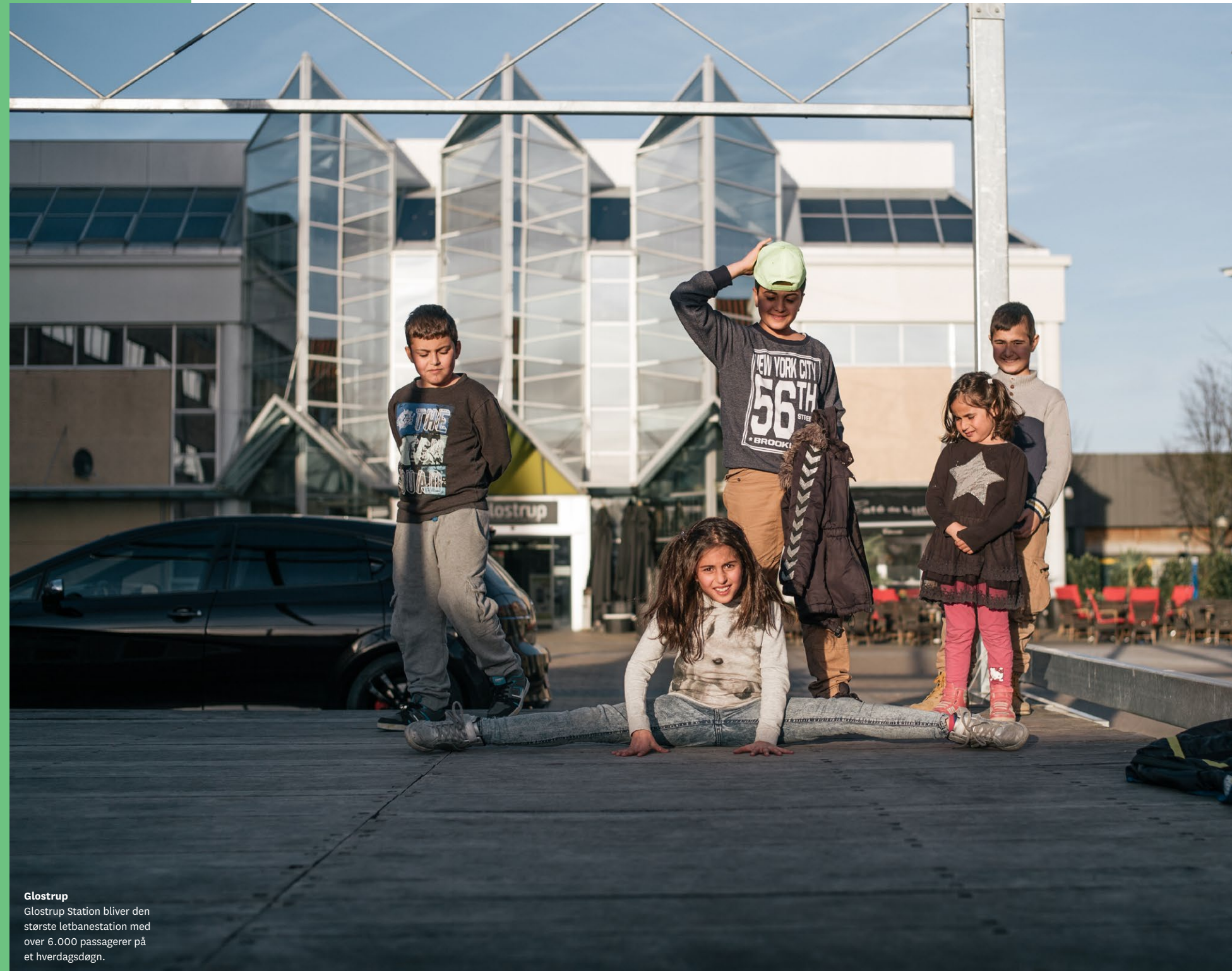
Glostrup Glostrup Station bliver den største letbanestation med over 6.000 passagerer på et hverdagsdøgn.