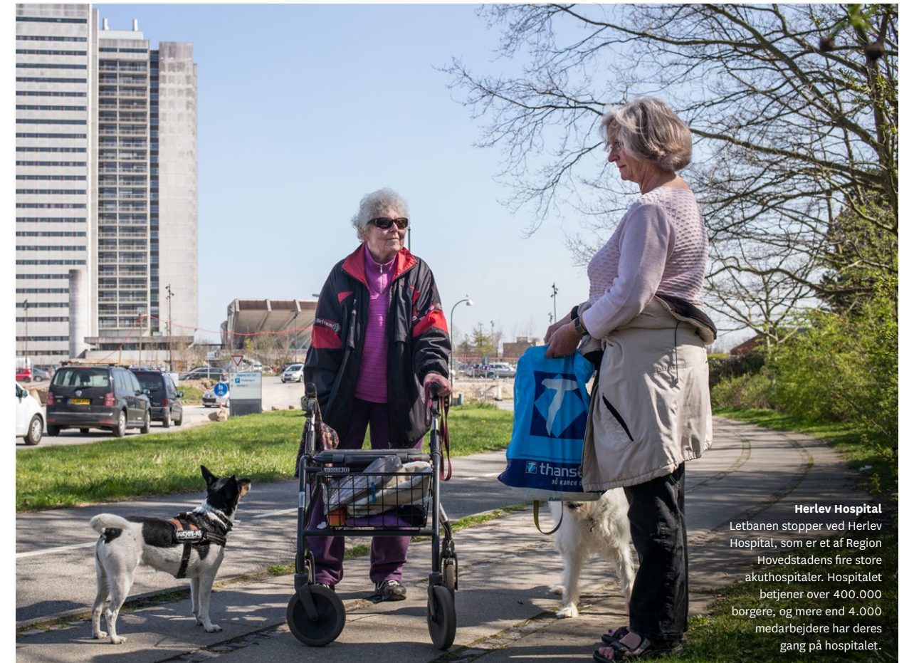
Herlev Hospital Letbanen stopper ved Herlev Hospital, som er et af Region Hovedstadens fire store akuthospitaler. Hospitalet betjener over 400.000 borgere, og mere end 4.000 medarbejdere har deres gang på hospitalet.