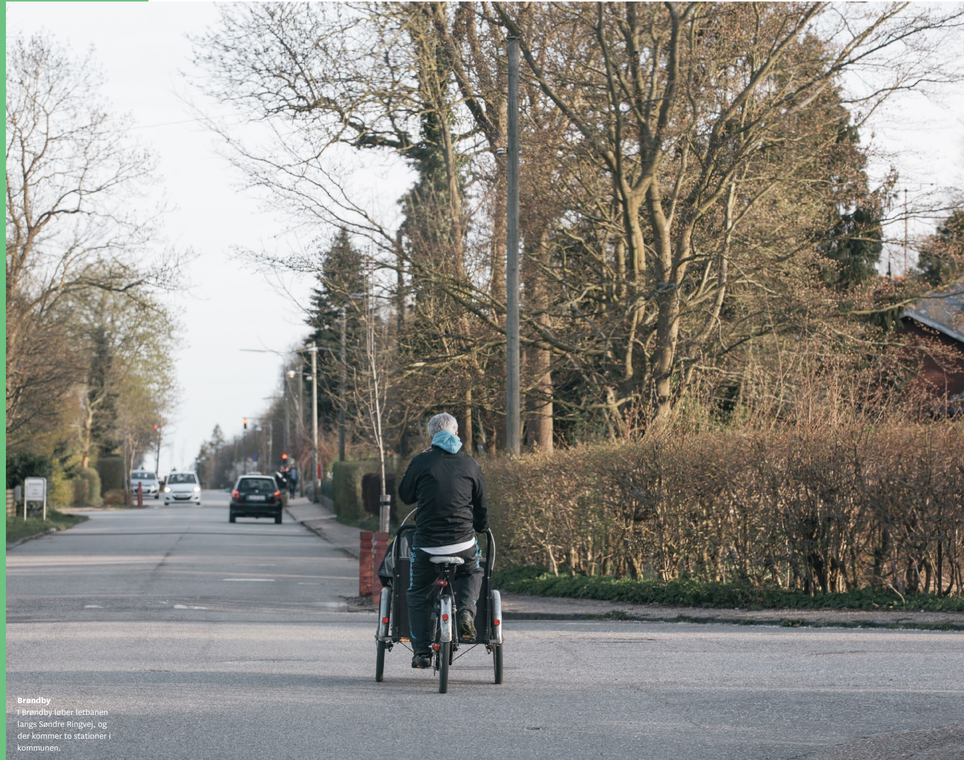
Brøndby I Brøndby løber letbanen langs Søndre Ringvej, og der kommer to stationer i kommunen.